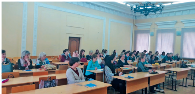
Работа научно-методического семинара в РГУ имени С. А. Есенина