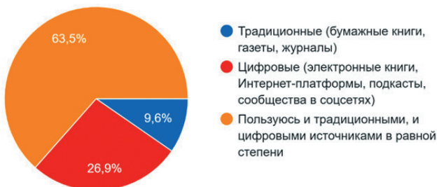
Рис. 2. Инструменты преподавания русского языка

Респондентам был предложен ряд вопросов, подразумевающих развёрнутые ответы, в частности, что необходимо сделать для того, чтобы люди хотели изучать русский язык. Ответы можно распределить на несколько блоков. Так, первый блок, составляющий 39% от общего числа ответов, связан с инструментами повышения интереса к русскому языку посредством преподавания русского языка в школах и вузах (см. рис. 2).