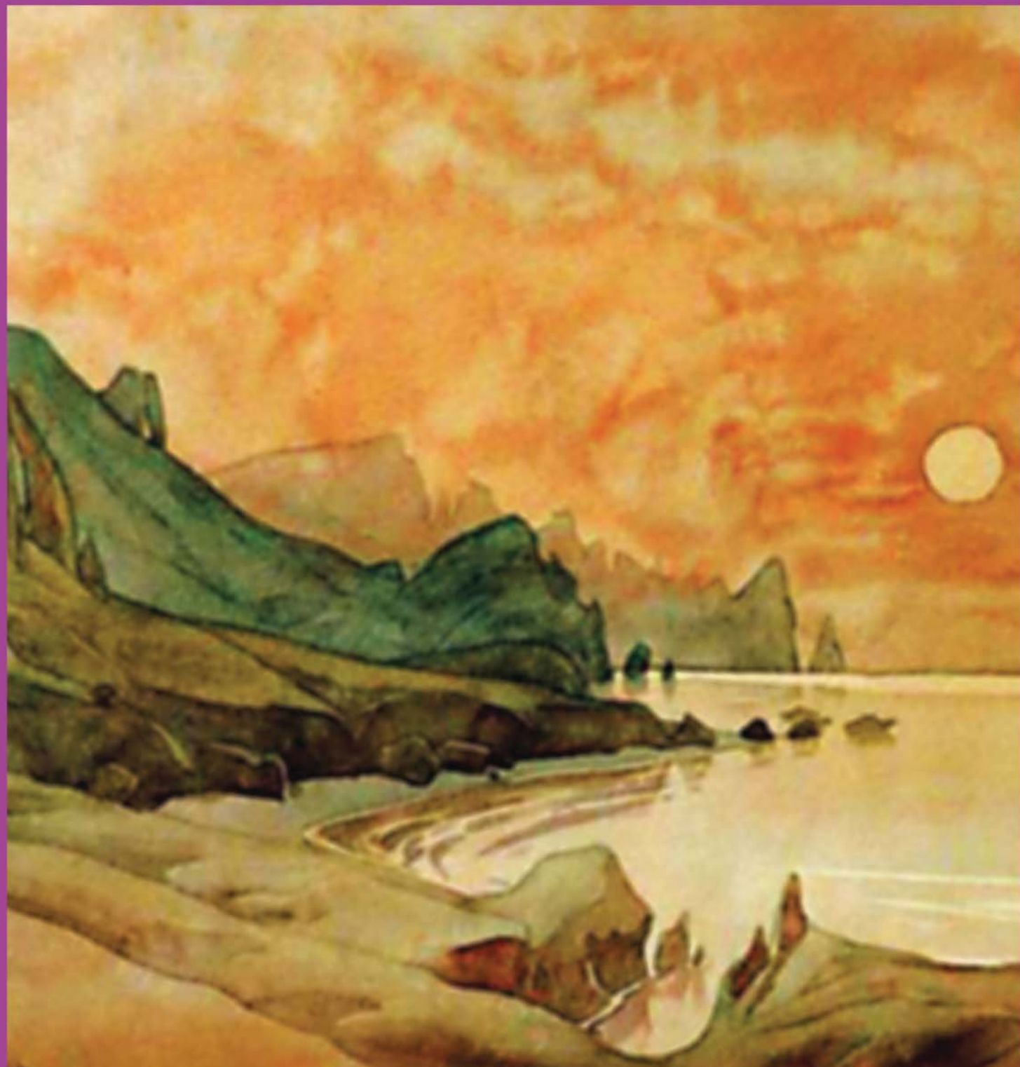
М. Волошин. Акварель. Из собрания дома-музея М. Волошина в Коктебеле