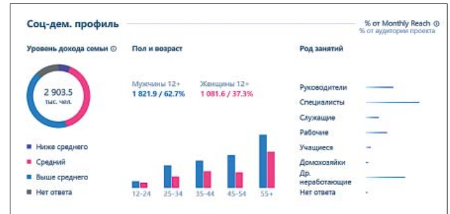
Рис. 1. Демографические показатели аудитории сайта «Коммерсантъ», октябрь 2021 г.

именно на сайт издания, имеющий широкую аудиторию. По статистике международной исследовательской группы TNS, аудитория «Коммерсанта» преимущественно состоит из интеллигентных, высокопоставленных, платежеспособных людей. Возрастной диапазон читателей издания широк, при этом среди читателей больше мужчин, чем женщин [TNS 2021].